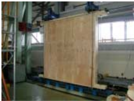
床の面内せん断試験

土台や基礎との取合部やバリアフリー対応を考えた仕様の検討を行いました。また、住宅品質確保促進法（品確法）への対応のため、床倍率を求める床面内せん断試験を行いました。