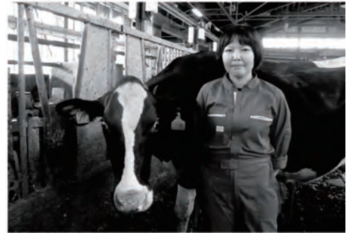
道総研 酪農試験場 乳牛グループ