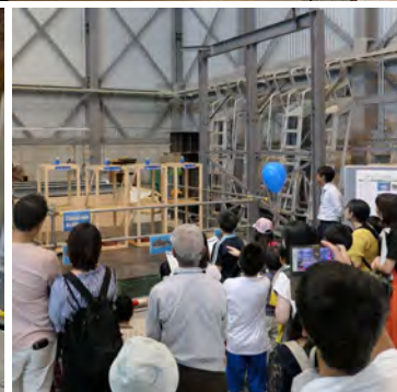
地震に強い建物を調べよう!