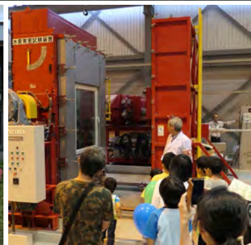
博士と研究所を探検しよう!