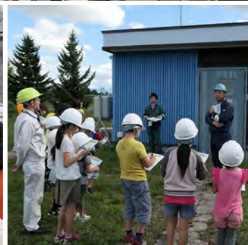
安全な家かどうか調査しよう!