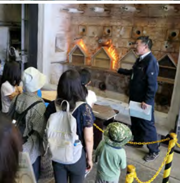
燃えにくい家を考えてみよう!