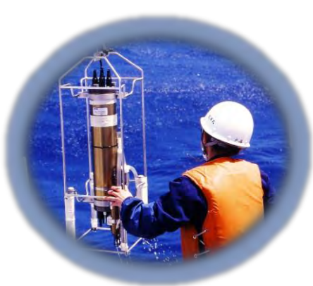
●しらべてみよう 水温・塩分計