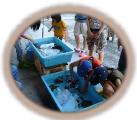
●さわってみよう タッチプール