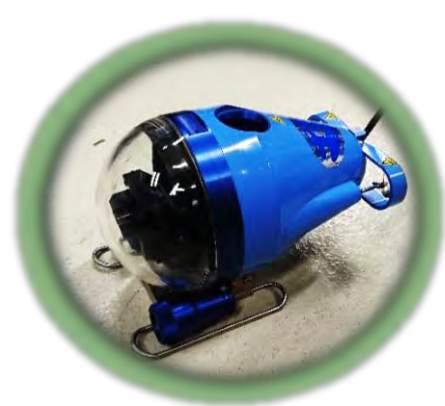
●のぞいてみよう 動く水中カメラ