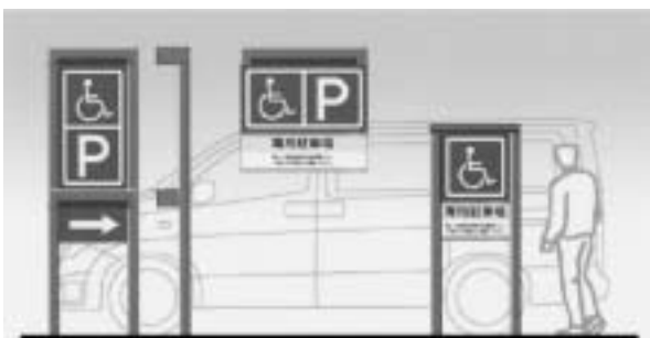
図3 車いす使用者優先駐車区画表示サイン

本事例においては主に、開発アイテム単体の要求事項に加え、駐車場空間など一定のまとまりを持った空間に係る要求事項の抽出手法など、プロセスにおける要求事項抽出の段階についての知見を得た。