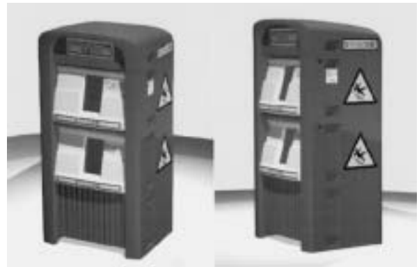
図4 歩行者用防滑剤収納箱

本事例では主に、これまでのケーススタディなどを通じて改善した試作プロセスの最終的な検証と、プロジェクト評価のステップなどプロセスにおける追加項目の抽出を行った。