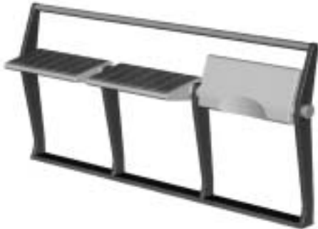
図2 折りたたみ式ベンチ

本事例においては主に、プロセスの全体構成についての課題を抽出した。その具体的な内容については3.4において後述する。