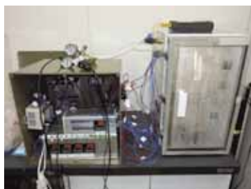
図1 多機能型細胞培養装置