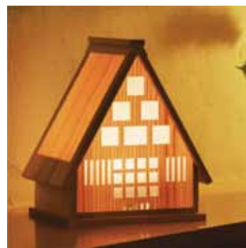
ゆらぎ照明「ひだまり」