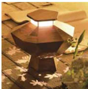
ゆらぎ照明「きんぎょ」