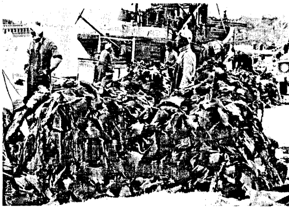
貝殻島産サオマエコンブの水揚げ

は何といつてもコンブの大生産地帯です。ナガコンブはマコンブ、リシリコンブのような良質コンブではないから、むやみに増殖する必要はないと言う声を聞かされることもあり。しかし現実の問題として、若しナガコンブの生産が今の二分の一に減つたとしたら日本のコンブ業界はおそらく大きさを維持するにちがひありません。どのコンブも増産が計られてこそ正常な姿が維持されるものであつて、そのためにはナガコンブの増殖手段につ