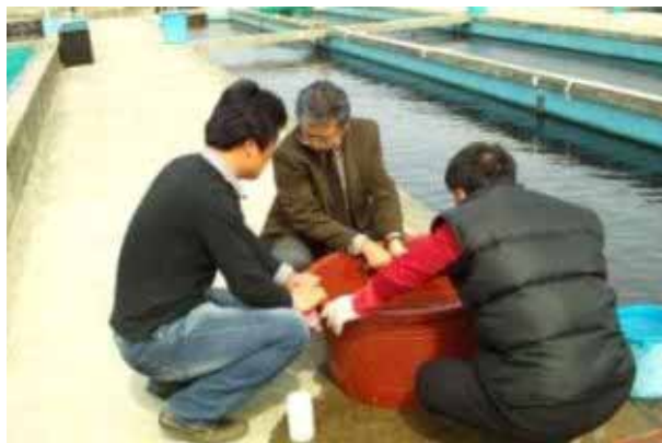
サクラマスモルトの選別指導

てはまらない。石原であり、淵もほとんど見られない浅瀬が連続していることから、サケやサクラマスの自然産卵域としては適当ではないと思われた。農業用頭首工には魚道が設置されているが、型式が古く、また通水も十分でないことからあまり機能していないと思われる。支流は大岩や岩盤が多く、サクラマスの産卵及び幼魚の生息環境としては厳しい条件である。一般に、南大川に限らず、視察した河川の本流や流域には河畔林がほとんどなく、サケマス類の生息には不適な環境が多いと考えられる。