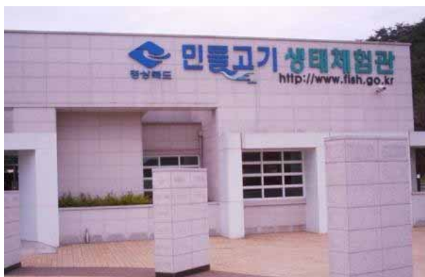
Gyeongbuk Research Center の付属水族館

その後、Gyeongsangbuk-do 道にある、Gyeongbuk Research Center for Freshwater Fish を見学。嶺東内水面研究所から南に車で約 2 時間半の距離にある道立の施設である。サケの人工孵化放流を行っている他、ニジマスやチョウザメの種苗生産も行っている。生産されたニジマス種苗は民間の内水面養殖業者に販売されている。こうした生産施設の他に大規模な淡水魚水族館 (充実した展示内容には驚かされた) も併設されており、事業施設も含めて一般市民が有料で見学することができる。研究所の研究者数は 2 人と少ない (ちなみに嶺東内水面水産研究所は職員 14 人のうち 4 人が研究者) が、予算規模は国立の嶺東内水面水産研究所の数倍との説明であった。