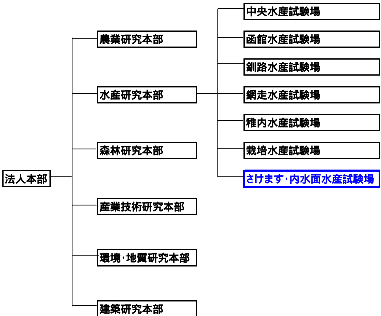
図1 . 地方独立行政法人 北海道立総合研究機構の機構図