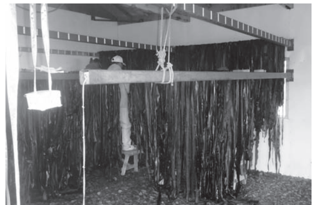
写真 水切りしたコンブを機械乾燥室へ搬入中 （歯舞地区）