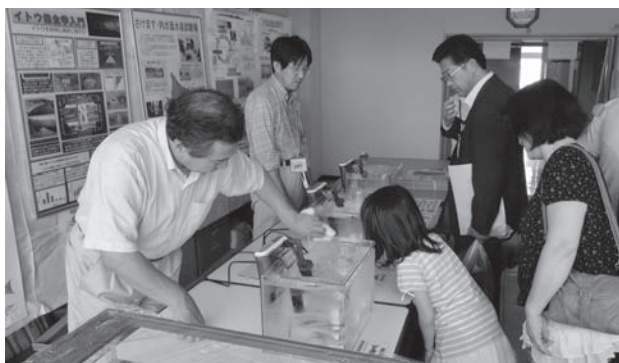
写真1 魚の生態について説明するさけます内水試職員