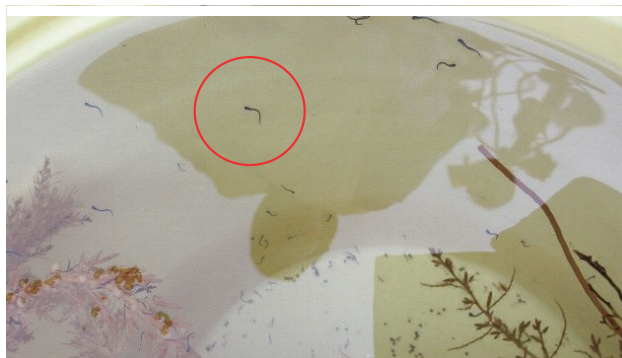
ふ化した仔魚(○内):平成24年7月