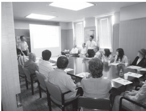
写真2 「サイエンスカフェ」の様子