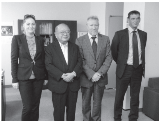
丹保理事長（道総研本部）を表敬訪問