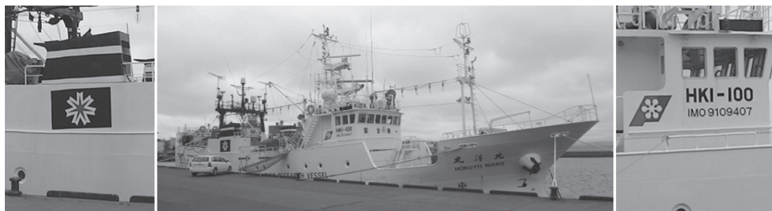
北洋丸(写真中央)の道総研マーク(船橋部:写真右)と北海道旗マーク(煙突部:写真左)