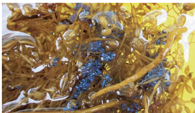
流れ藻に生み付けられた卵(青い部分):平成24年7月