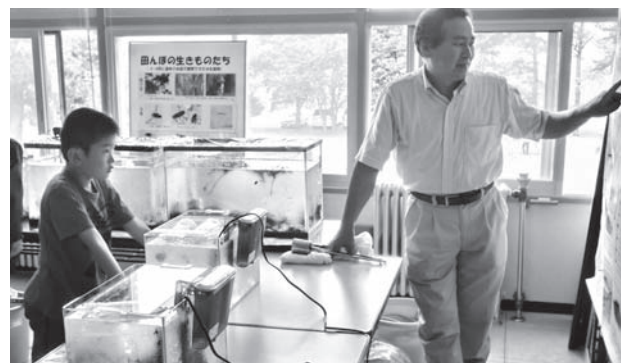
写真2 わかりやすく解説するさけます内水試職員