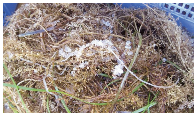
流れ藻に生み付けられた卵(白い部分):平成23年8月