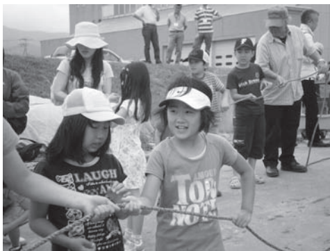
写真1 「地びき網体験」の様子