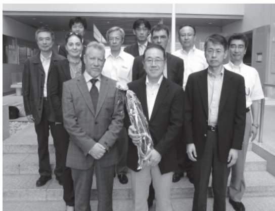
中央水試ロビーでの記念撮影

・パーティー。日口の研究者同士の熱い議論が続き、通訳者の方もてんてこ舞いになるほどでした。