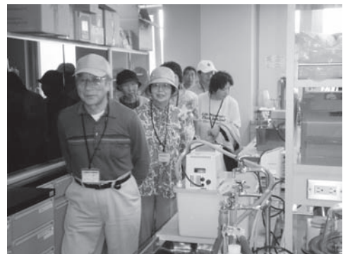
写真4 「試験場内探検ツアー」の様子