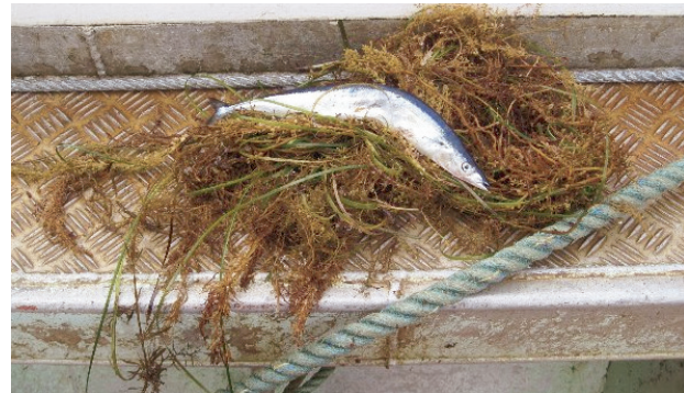
流れ藻と採集されたサンマ:平成23年8月