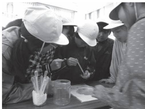
体験学習の様子(プランクトンをスポイトで採集)