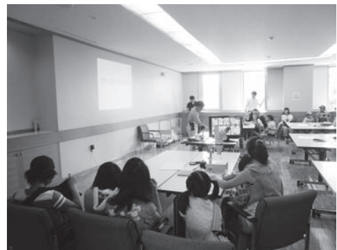
写真3 「親子で学ぶプランクトン教室」の様子