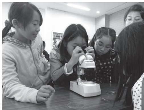
体験学習の様子(実体顕微鏡で観察)