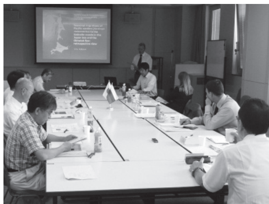
研究発表、情報交換