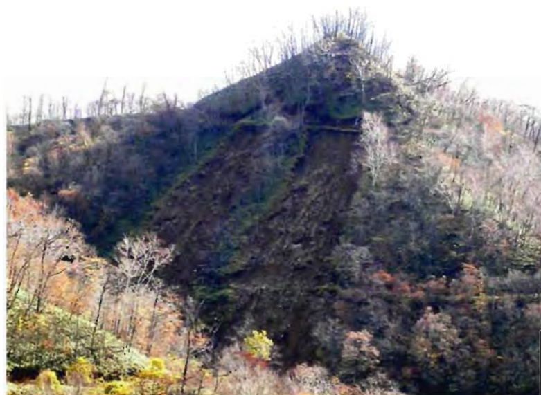
写真-2 上下の集材路にまたがって広がる崩壊地