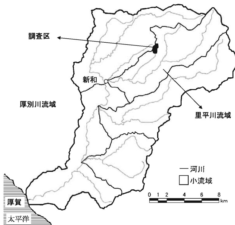
図-1 厚別川流域と調査区の位置図

調査区内の集材路は1993年の天然林択伐時に敷設されたもので、調査区内の総延長は12,464mで面積当りの路網密度は152m/haである。集材路は等高線沿いに配置されており、路幅は約3mである。路上にはミヤコザサ、木本類などの植生が回復しつつある(写真-1)。