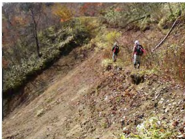
写真-1 集材路上の植生の回復状況と路肩から発生した崩壊地

2003年台風10号より調査区内では53箇所、合計59,975㎡(崩壊面積率7.3%)の崩壊地が発生した。図-2に崩壊地の分布、集材路の配置、遷急線の位置を示した。遷急線は1mのコンターマップを用いて、斜面上部から下部に向かって傾斜が急になる変換点をつなぐことにより描いた。道路を作る際に生じる切土および盛土斜面が、斜面を不安定化させ、崩壊の引き金になると言われているため、ここでは集材路付近から発生している崩壊地(写真-1)を集材路が原因で崩壊した可能性が高いもの、それ以外を集材路が原因である可能性が低いものとした。ここでは、集材路付近から発生している崩壊地とは集材路から崩壊地最上部までの距離が4m以内のものとした。