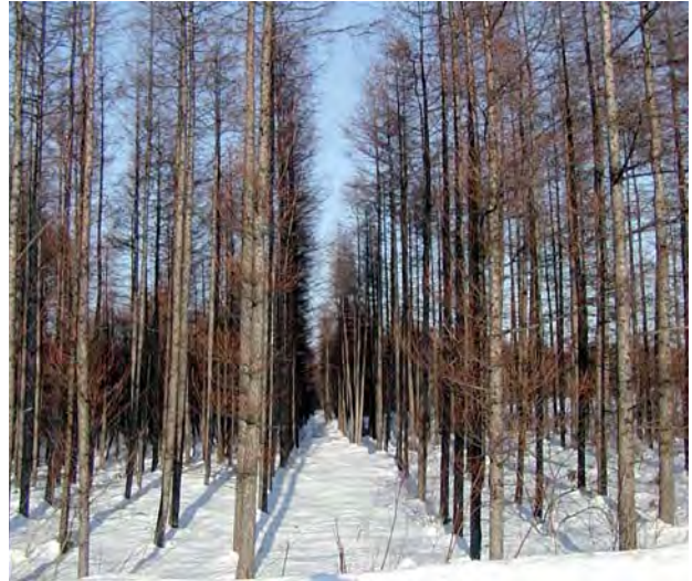
写真－1 列状間伐が行われたカラマツ林

そこで、伐出・造材経費を節減し間伐を推進して林業再生に資するために、近年、高性能林業機械を用いた列状間伐（写真－1）が薦められています。しかし、実際に高性能林業機械で列状間伐を行うためには、伐木・造材作業の設計を行い、立木売払いにおける予定価格や入札価格を算出する必要があります。そのためには、あらかじめ列状間伐における高性能林業機械の生産性を把握しておく必要があります。人工林で間伐を行う場合には、伐倒・枝払い・玉切り・集積・はい積みを行うことができるハーベスタ（写真－2）という機械が使用されることが多くなっています。光珠内季報第144号においては、定性間伐におけるハーベスタの生産性の推測方法について紹介しましたが、列状間伐におけるハーベスタの生産性についてはこれまで詳しいことがわかっていませんでした。そこでこの報告においては、定性間伐と列状間伐におけるハーベスタの生産性の違いについて紹介し、さらにその意義について考えてみたいと思います。