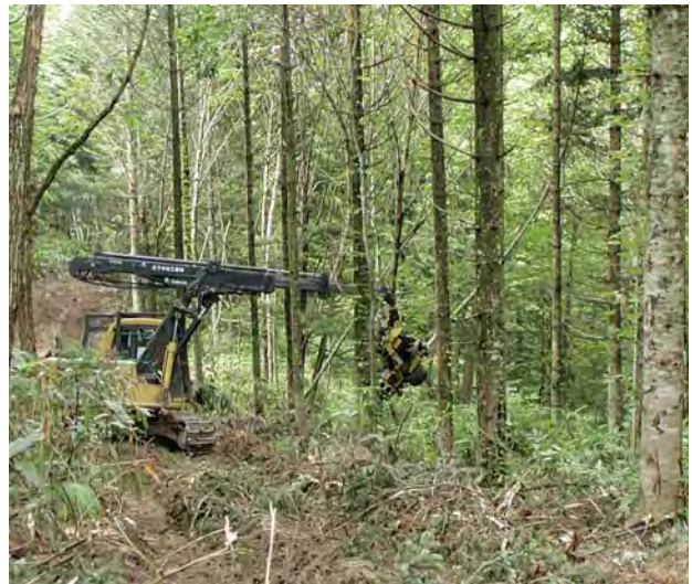
写真－2 トドマツ林内で伐倒・枝払い・玉切り・集積を行っているハーベスタ