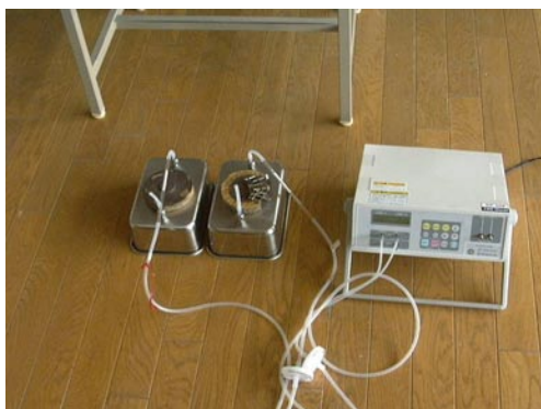
写真1 林産試験場型 問題部位探索装置

写真 1 は林産試験場で使用している放散部位探索装置です。ステンレスの容器を放散源となりそうな場所に取り付けてしばらく放置した後、容器中に溜まった VOC を測定します。そして、いくつかの場所で測定したものを比較して、高い数値を出した部分がどうやら怪しいということで、精密測定を行います。