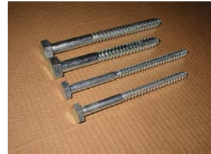
写真 ラグスクリュー

ラグスクリューは本来はせん断力を負担させるために用いられますが、引き抜き力にも抵抗させることができます（図2）。