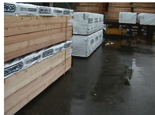
写真3 乾燥材（奥）と未乾燥材（手前）の梱包 （インターナショナル・フォレスト・プロダクツ株式会社エイコーン工場）