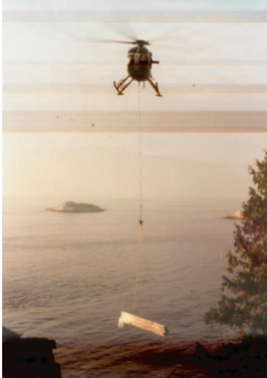
写真7 ヘリコプターによる建材運搬