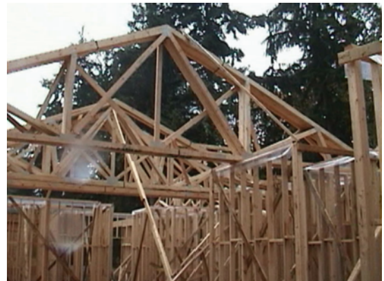
写真5 2×4工法住宅の建築現場 （カナダ、バンクーバー郊外）

現地では含水率変化による狂いが大きい樹種として認知されているヘムファー（ベイツガ）が使われていますが、これをカラマツに置き換えることは可能との印象も受けました。