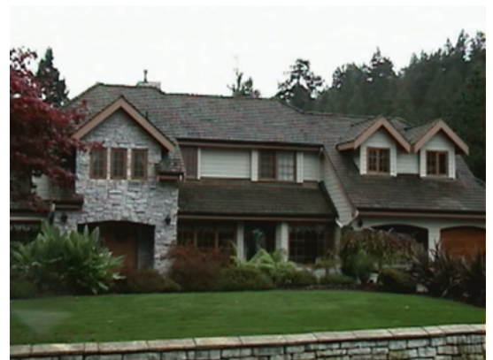
写真6 2×4工法による一般的な住宅 （カナダ、バンクーバー郊外）