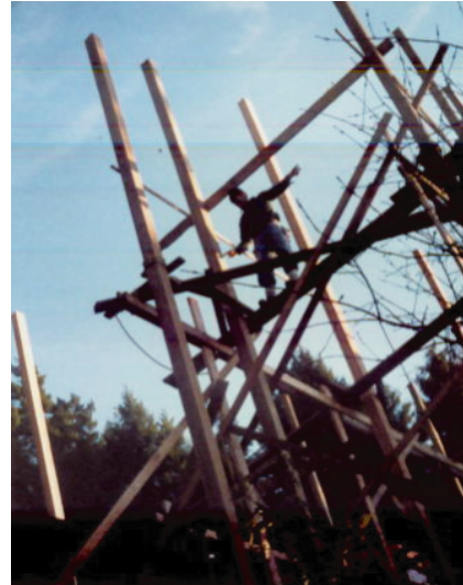
写真8 ヘリコプターによる通し柱の釣り込み

現在，日本における新築木造住宅戸数に占める2×4工法住宅の割合は16.3%（北海道では21.4%）ですが，年々増加する傾向にあります。将来，カナダ式の住宅が日本でも増えていくかもしれません。