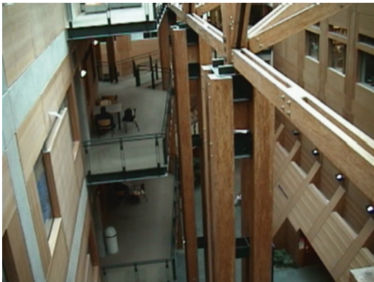
写真1 大学内で使用されている構造用集成材 （UBC，ブリティッシュ・コロンビア大学）