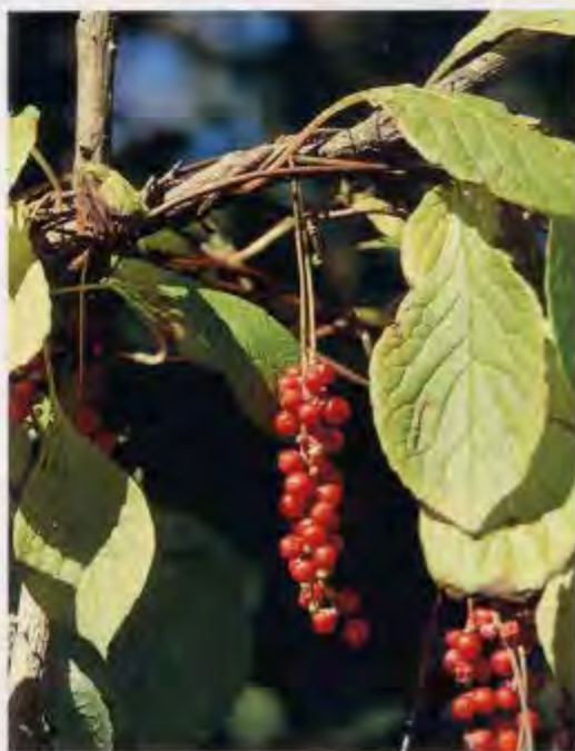
チョウセンゴミシの果実：果実には甘、辛、酸、塩の5つの味があり、果実酒としても利用されます。