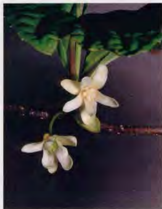
チョウセンゴミシの花：これまで雌雄異株とされてきたが、1株に雄花と雌花の両方が着いているものがしばしば見られます。

林業試験場では平成元年度から道立衛生研究所と共同で、果実の収量を決める要因や、薬効成分の含有量について調べています。チョウセンゴミシの結実には別の個体の花粉で受粉することが重要で、そのためには、開花期に農薬を使わないなど、昆虫による受粉を妨げないようにすることが必要です。また、ふやし方は実生やさし木が容易であること、薬効成分の含有量には、個体差があることなどが明らかになりました。そのため、今後は優良個体の選抜基準や選抜方法についても研究を進める予定です。