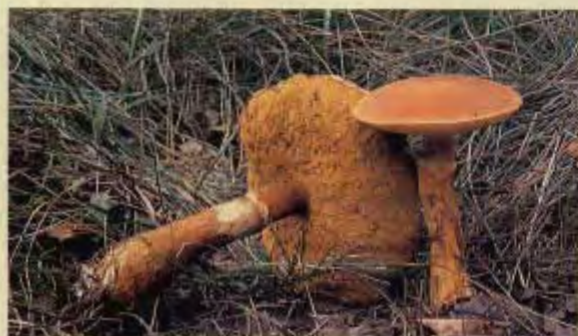
ハナイグチの子実体 (落葉きのこ)

カラマツの根の表面には、ハナイグチなどのキノコの菌糸が共生しています。このような根のことを菌根といいます。