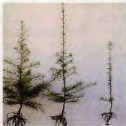
カラマツ ハイブリッドカラマツ ギイマツ 2年生苗の比較