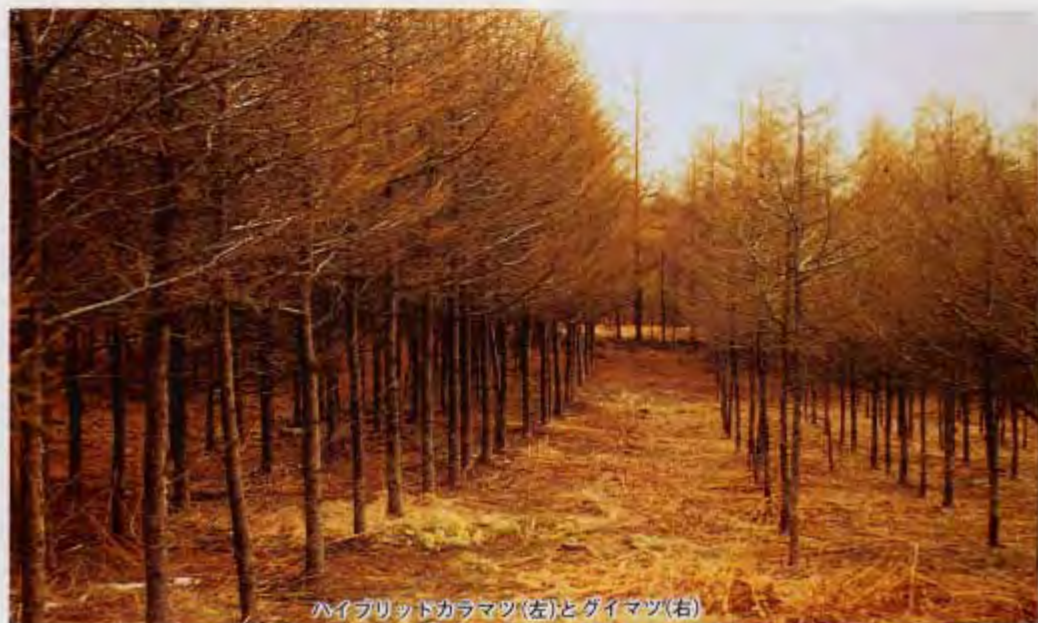
ハイブリッドカラマツ(左)とギイマツ(右) 生長の比較 (10年生)

表紙の説明 ハイブリッドカラマツは、ギイマツを母親とし、カラマツを父親とした一代雑種(F 1 )です。両親の長所を受け継ぎ、生長がよく、ギイマツ苗とくらべて枝数が多く、冬芽形成時期が1ヶ月ほど遅くなります。また、カラマツにくらべ野ねずみに食われにくく、幹がまっすぐです。