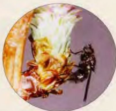
写真-2 球果の基部で産卵する雌成虫

この幼虫はカラマツの球果（マツボックリ）の中で種子（たね）を食べて育ちます（写真-1）。1つの球果では1匹の幼虫しか育ちません。そこで、雌成虫は球果に産卵した後、球果の頂上部をなめ回して（写真-3）、その球果が産卵済みであることの目印とします。他の雌成虫が産卵にやってくると、まず球果の頂上部を歩き回ります。ハエは歩き回って足の毛でなめた跡に残された物質が分かるのです。なめた跡があれば産卵せずに飛び立ちます。なめた跡がなければ球果の基部で産卵します（写真-2）。この物質は他の雌の産卵を回避するためのフェロモンです。この産卵回避フェロモンを人工合成して散布すれば、ハエは産卵済みと錯覚して、その球果には産卵しないはずで、この物質を人工合成するために大阪市立大学理学部、九州大学理学部と共同研究を行っています。