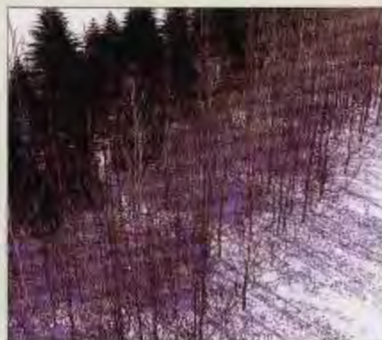
森林をいろいろな角度から眺めたり、成長に伴う景観の変化をみることもできます。

樹木の組み合わせや木の成長にともなう時間的な景観変化を画像上で予測することができ、植栽計画・緑環境計画などの新しい手法としてその活用が期待できます。