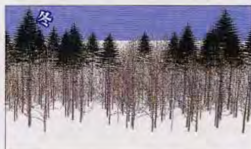
森林景観の季節変化（針葉樹材積比率25%）

樹木の成長の様子や森林景観をコンピュータグラフィックスを用いて立体的に図示する方法を道立工業試験場と共同で開発しました。針葉樹と広葉樹の比率を変えて表示したり、季節の移り変わりを画像で立体的にみることが出来ます。