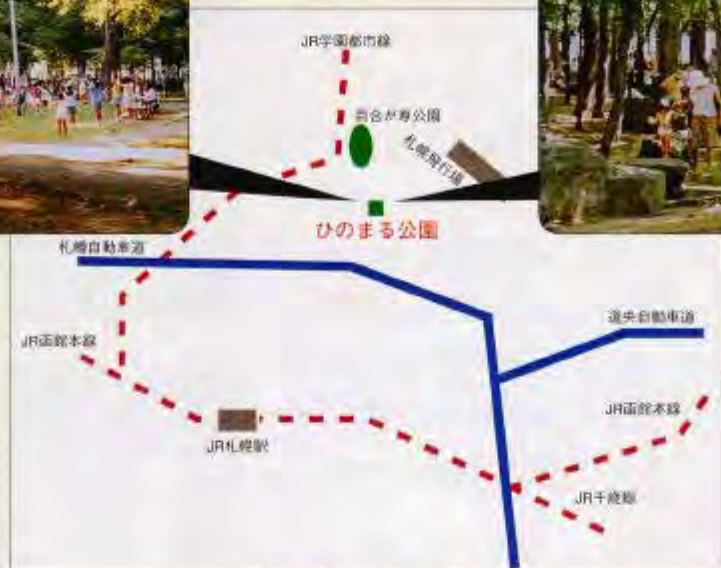
ひのまる公園位置

都市化の進展により、市街地には孤立した林が多くなっています。このような林は面積こそ小さいですが、その自然を生かして整備をすれば貴重な憩いの場になります。