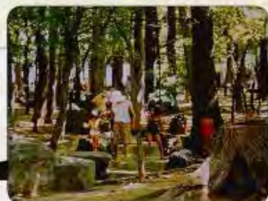
遊水路で楽しむ人たち