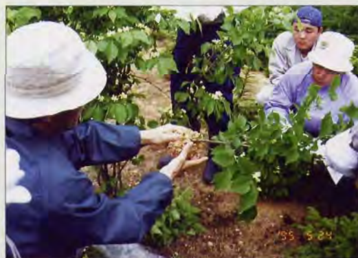
緑化技術者養成講座(Ⅰ)

★受講については、あらかじめ申込みが必要です。希望される方または詳しい講座内容を知りたい方は、北海道立林業試験場、最寄りの各支場、各支庁林務課、各林業指導事務所にお問い合わせください。