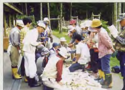
フォレストガイド養成講座(Ⅰ)