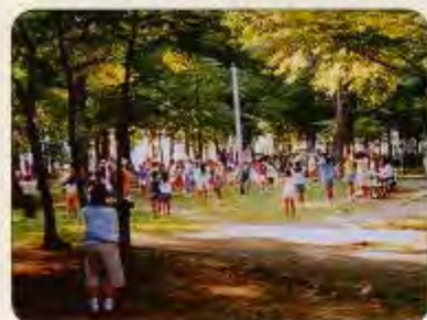
ラジオ体操の様子