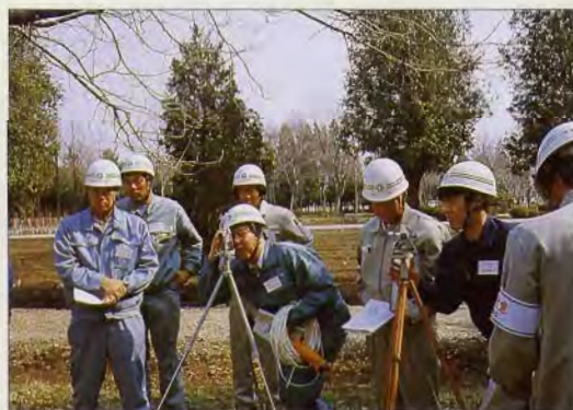
林業技術者養成講座(Ⅰ)