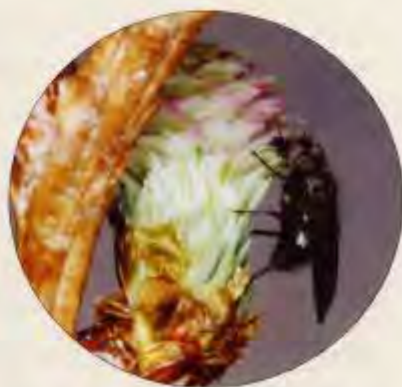
写真-3 産卵後球果頂上部をなめ回して産卵回避フェロモンを塗る雌成虫