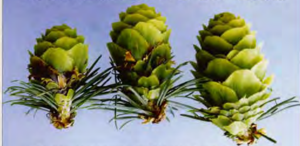
写真-1 カラマツタネバエの幼虫にラセン状に種子を食べられた球果（左の2個）と健全な球果（右）

カラマツ球果の害虫の新しい防除法を研究しています。害虫の名はカラマツタネバエで、10年に一度ほどやってくる球果の大豊作の年以外では8割以上の球果が食べられてしまいます。