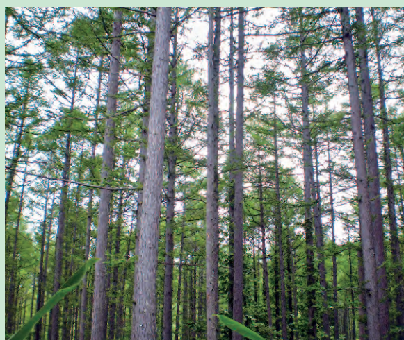
写真-1 カラマツ林が成林した例