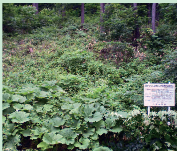
写真-4 無立木地化した例