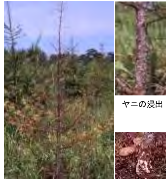
全葉の黄化、褐変 白色菌糸膜と子実体

備考： 土壤水分の過多・極度の乾燥・環境条件の劇的な急変などストレス状態にさらされた林木が被害を受ける。戦後の拡大造林に伴って、北海道・東北では甚大な被害が発生した。被害の拡大経路としては、根同士の接触による罹病木から隣接木への感染、土壤中に蔓延した根状菌糸束からの感染、子実体が形成する孢子からの感染がある。病原菌が伐根・倒木などを餌資源として土壤中で長期間生き続ける本病の根本的な防除方法はないが、①過湿地などカラマツの生育不適地への植栽を避ける、②罹