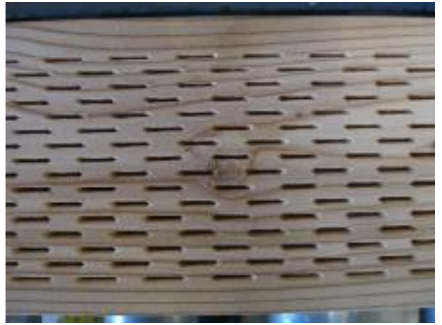
写真1 インサイジング装置（左）とインサイジング処理された材料（右）