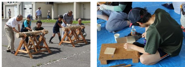
【木になるフェスティバルの様子】

7月29日（土）に開催した第26回木のグランドフェア「木になるフェスティバル」には、今年は571名の方々の参加がありました。各種の科学体験や木材の3D加工実演、耐火試験の実演、シェービングマシンで製造したストランドのしおりづくりも好評でした。棚を作る木工体験コーナーや、木の板と接着剤を使った工作体験、きのこアクセサリ、ヨーヨーの製作等も行い、今年も多く参加者に楽しんでもらえました。森林や木材の良さを感じてもらえた一日だったと思います。