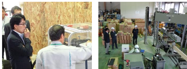
【増田北海道顧問訪問の様子】

6月23日（金）、増田寛也北海道顧問の訪問を受け、CLTの曲げ試験実演、CNC木工旋盤の実演、ヤナギおが粉を培地としたシイタケ栽培、カラマツ建築材（コアドライ®）やシラカンバ内装材などをご覧いただきました。