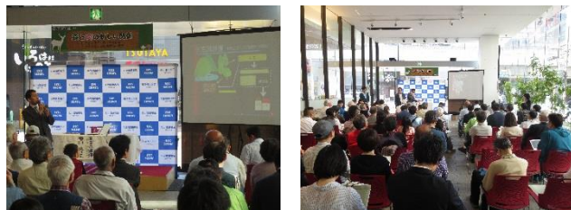
【道総研セミナーの様子】