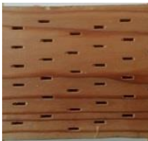
写真3 吹付装置（左）と深浸潤処理されたカラマツ集成材（右）