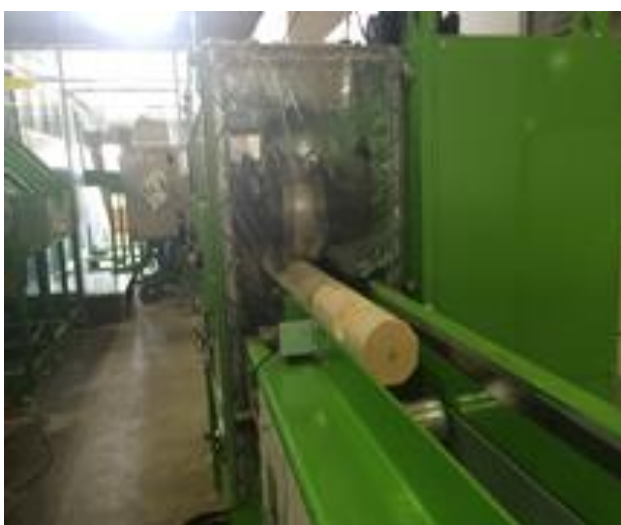
写真4 圧縮処理の様子

（事務局より：本稿は「山づくり」2017年1月号への投稿記事を再編集したものです）