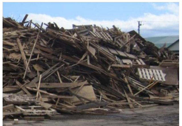
写真 創業期（上、出典：北海道の林業）と現在（下、イワクラ提供）のイワクラPB原料