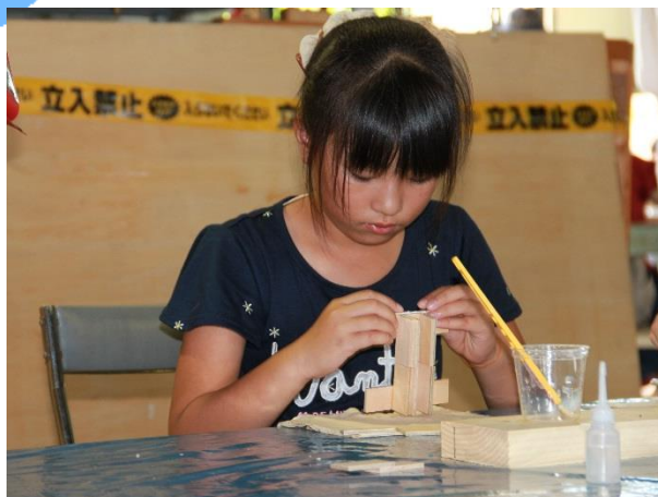
木になるフェスティバルの様子 (林産試ニュースより)