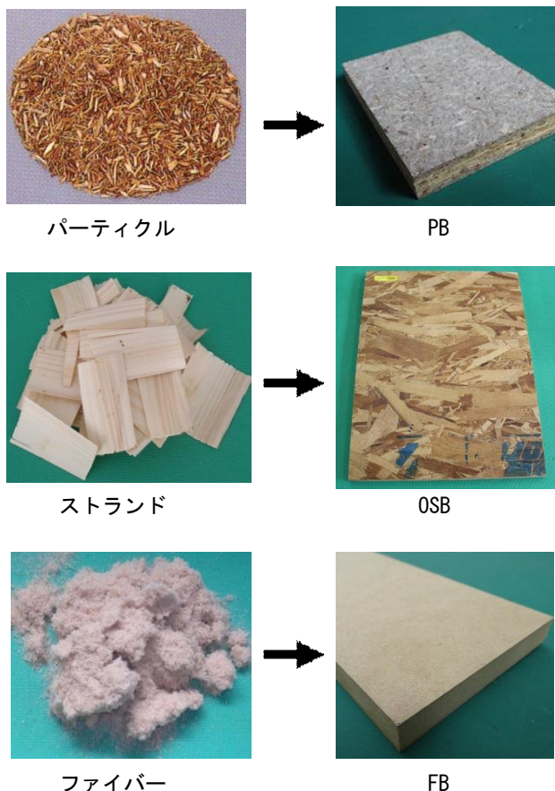
図 木質ボードの構成要素と種類

用途は、①床、壁、屋根など住宅下地材（主にPB、OSB）、②フローリング、窓枠など建材基材（MDF、PB）、③畳の芯材（IB）、④キッチンやクローゼットなど住設機器基材（MDF、PB）、⑤テーブル、ベッドなどの家具基材（PB、MDF）、⑥断熱材（IB）など身の回りで幅広く使われているのですが、ほとんどが下地材や基材に用いられるため普段目にすることはありません。