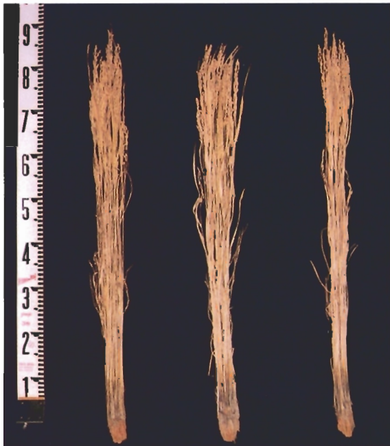
ななつほし きらら397 ほしのゆめ