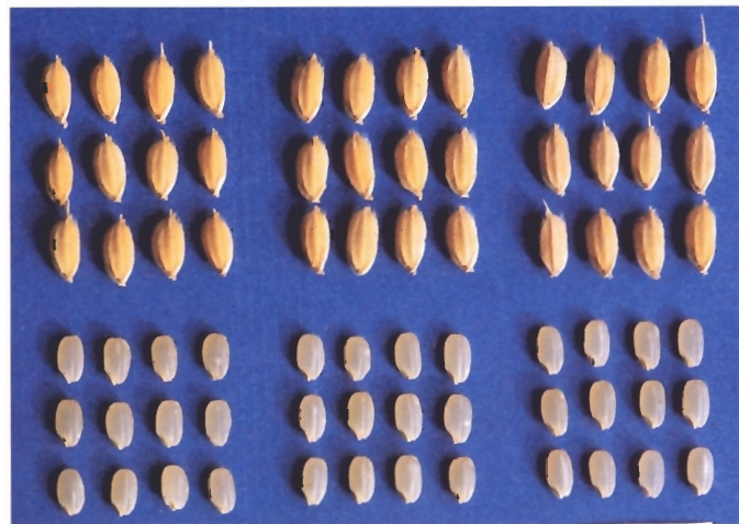
ななつほし きらら397 ほしのゆめ