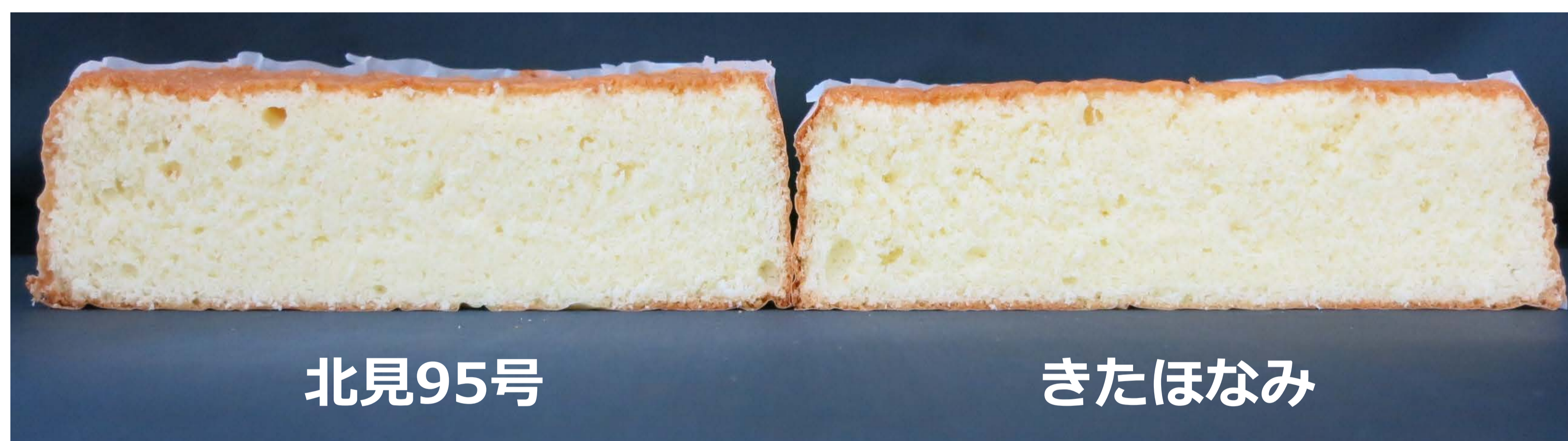
北見95号 きたほなみ