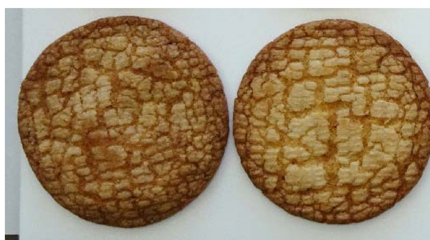
北見95号 きたほなみ