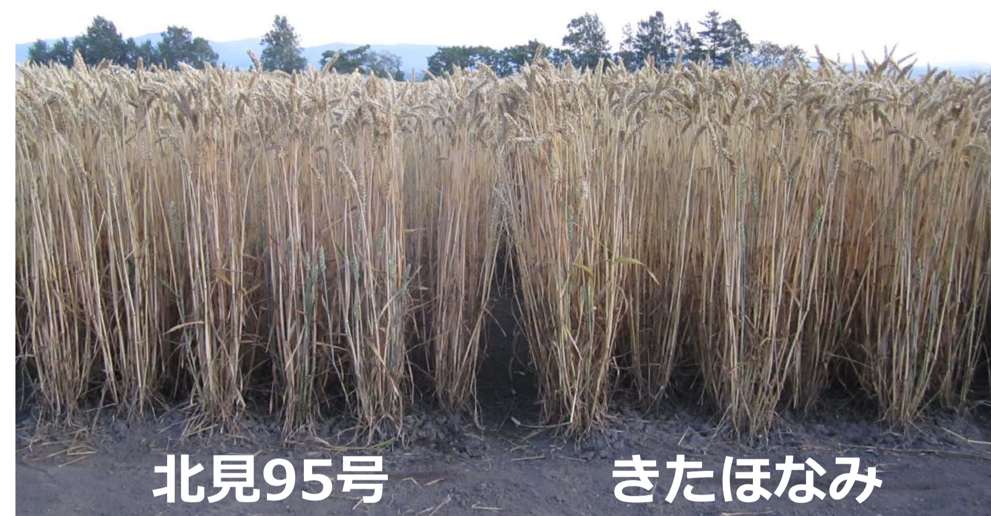
北見95号 きたほなみ