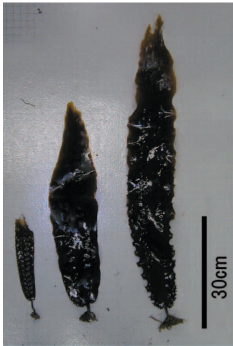
図1 平成16年9月6日に稚内市宗谷竜神島で採集したチヂミコンブ藻体