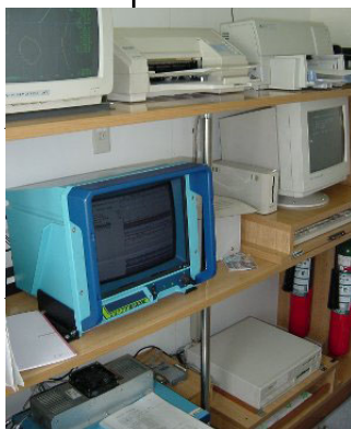
計量魚探船上設備

水温は、どの観測点でも、表面で10°C前後、水深50m付近で6.5°C前後でした。これらは昨年より最大で3°C程度低い値ですが、平成9～13年と比較すると平均的です。