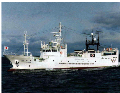
試験調査船 北洋丸

時化による欠測が多いため確実な比較ができませんが、水深100m以浅では、北西側の1点をのぞき、例年と比べて高め(10°C前後)の水温が観測されました。