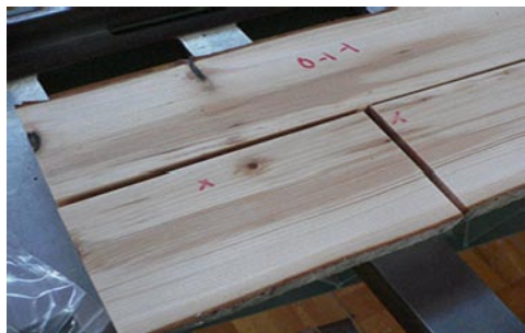
写真1 トドマツ水食い材