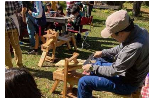
⑧10/16標津町きつつきの森