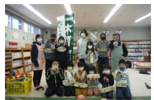
④12/5旭川市東光児童センター