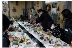
⑥10/18森町波多野エクスガーデン等