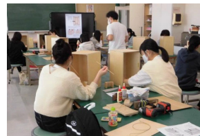
⑦10/7帯広市帯広大谷短期大学