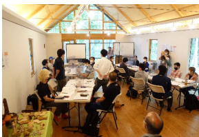
①9/6苫小牧市イコロの森