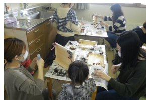
③11/26中頓別町認定こども園