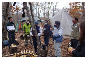
②11/1苫小牧市イコロの森