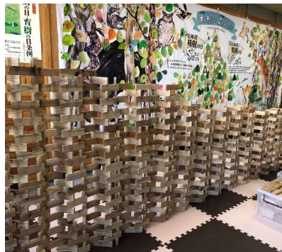
積木を使った「ナイアガラの滝」

新型コロナウイルス感染症の影響で休校やイベント中止が相次ぐ中、ご自宅で少しでも木育に親しみ、楽しんでもらうため木製遊具の紹介や遊び方、簡単にできる木育ワークショップなどを、フェイスブック「北海道のmokuiku（木育）」などにて公開しています。