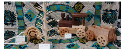
小型の木製遊具（上）、「森のピタゴラス」（左下） 経木でしおりづくり（右下）