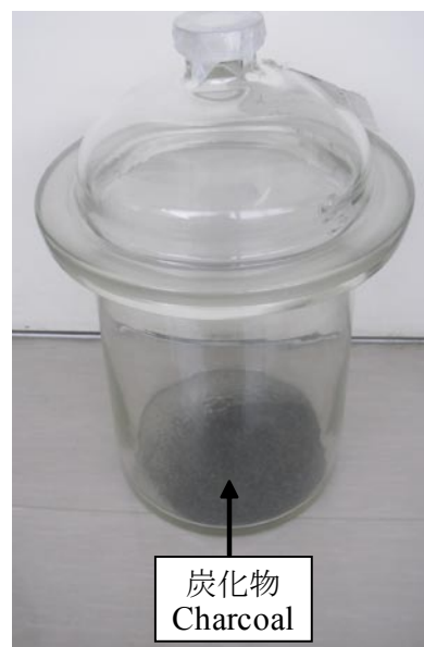
第 1 図 炭化物を入れたウィットろ過鐘 Fig. 1. Charcoal in filtratio bell of Witt.

トルエン、酢酸エチル、36.5%ホルムアルデヒド水溶液をそれぞれ別に、ガスクロマトグラフ用マイクロシリジで液体としてろ過鐘の口から注入し、パラフィルムでふたをした。ここでは、どのくらいの濃度までの吸着能力があるかについて調べるため、50～1400ppm になるように注入した。初期濃度が一定になる時間を測定した結果、トルエンと酢酸エチルの 250ppm 以下の場合には 10 分後、700ppm と 1,400ppm では 30 分後、ホルムアルデヒドでは 24 時間後であることがわかった。そこで、それぞれの所定時間後に、ガステック検知管で初期濃度を測定した。次に、105℃で 24 時間乾燥したそれぞれの炭化物約 1g をろ過鐘に投入し、4 時間、24 時間経過後の濃度を同様に測定した。それぞれについて炭化物を投入しないブランク濃度を測定し、補正した。