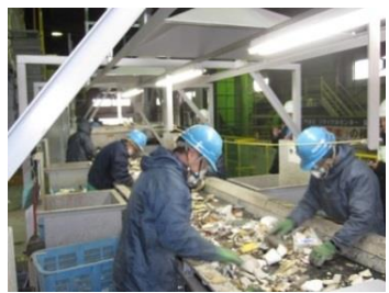
ライン選別の導入