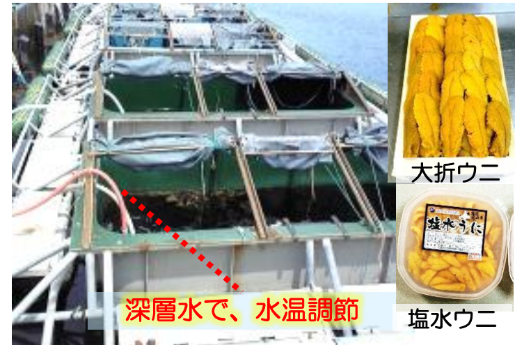
漁港に浮かべた、事業規模水槽