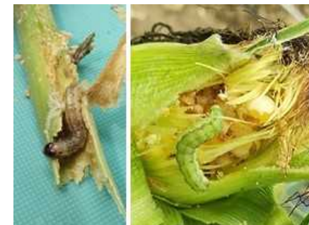
アワノメイガ幼虫