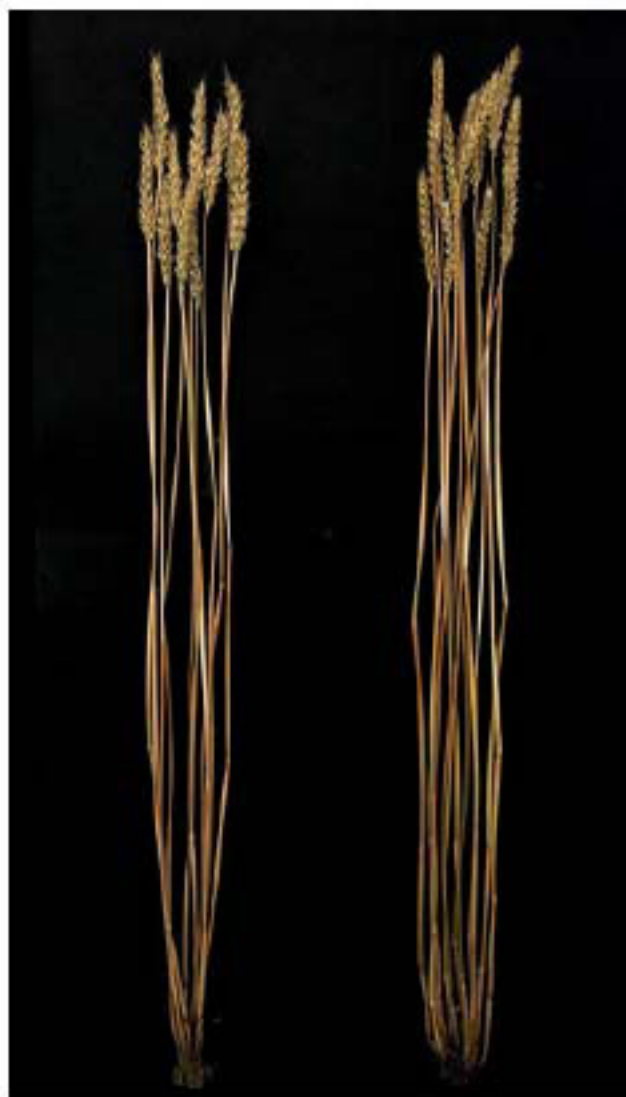
(左:「きたほなみ」、右:「ホクシン」)