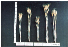
Siete Cerros Pal 1 Tab-8156(B) ハルヒカリ ハルニタカ