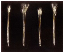
「春のあけぼの (原)」 「北条春ささき (交)」 「はるひので」 「はるひので」