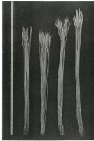
新大粒六號 新大粒六號 新大粒六號 新大粒六號