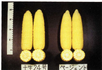
「スイートメモリー」