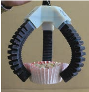
ソフトロボットハンドの例 (従来技術)