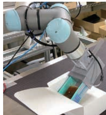
試作品による食品の 箱詰めの様子

このため、構造を見直し強度や耐久性を向上させ、薄型のソフトロボットハンドを実現しました。