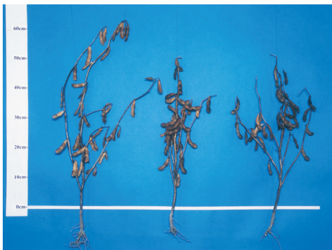
「中生光黒」 「いわいくろ」 「トカチクロ」