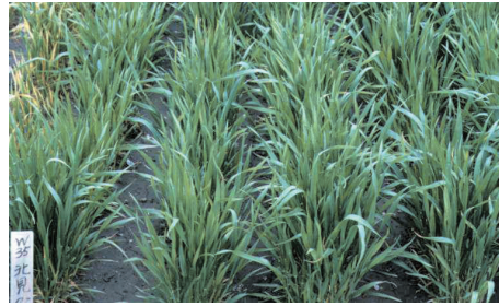
「きたもえ」 (抵抗性やや強)