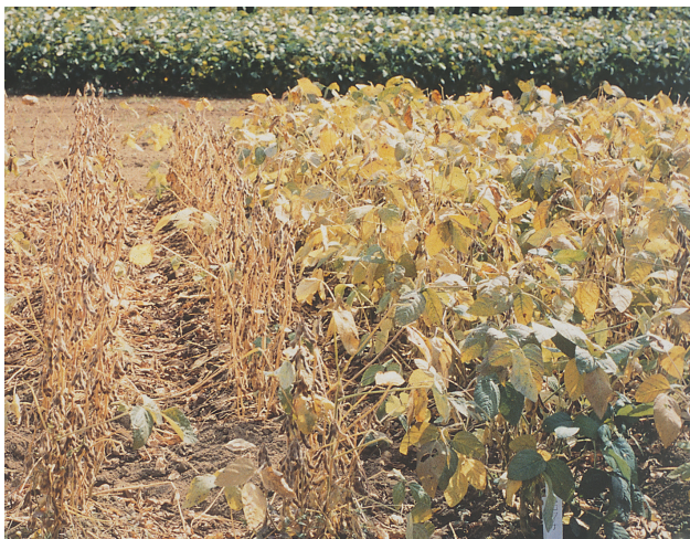
「ユキホマレ」 「トヨコマチ」