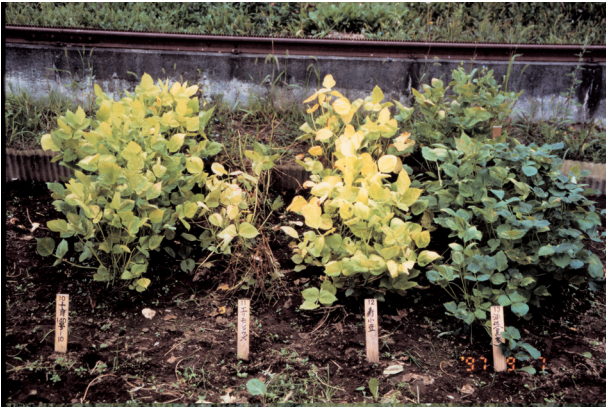
「しゅまり」 「エリモシヨウズ」 「寿小豆」 「浦佐(島根)」 (かなり強) (弱) (強) (かなり強)