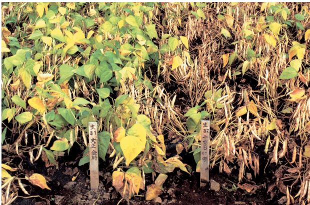
「大正金時」 「福良金時」 成熟期における草姿の比較

「福良金時」は「大正金時」と比べ, 成熟期, 耐倒伏性は同等で, 成熟期の葉落ちが良い。