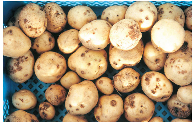
「男爵いも」 (そうか病抵抗性「弱」)