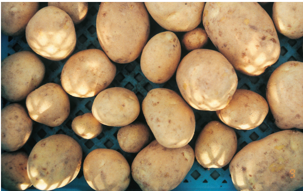
「スノーマーチ」 (そうか病抵抗性「強」)