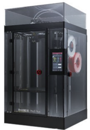
Raise3D Pro2 Plus