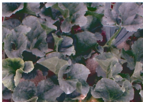
「ルピアレッド」自根区