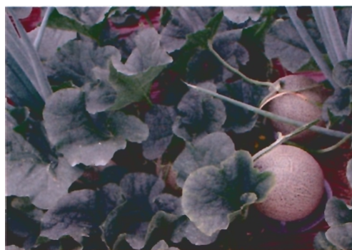
「空知台交3号」接ぎ木区