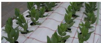
4列のゆったり植え