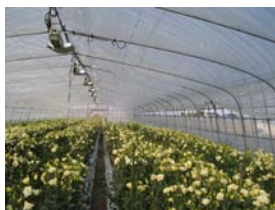
ナトリウムランプで補光