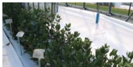
光を反射するマルチ