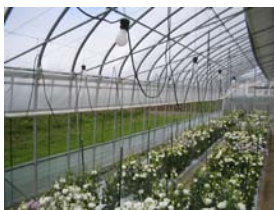
白熱灯で朝夕電照