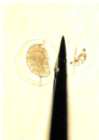
胚(受精卵)からの試料採取 (性判別試料として牛胚の一部を切り取る)