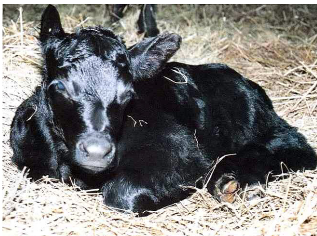
性判別した胚を移植して生まれた子牛 (性別は雄でPCRによる結果と一致)