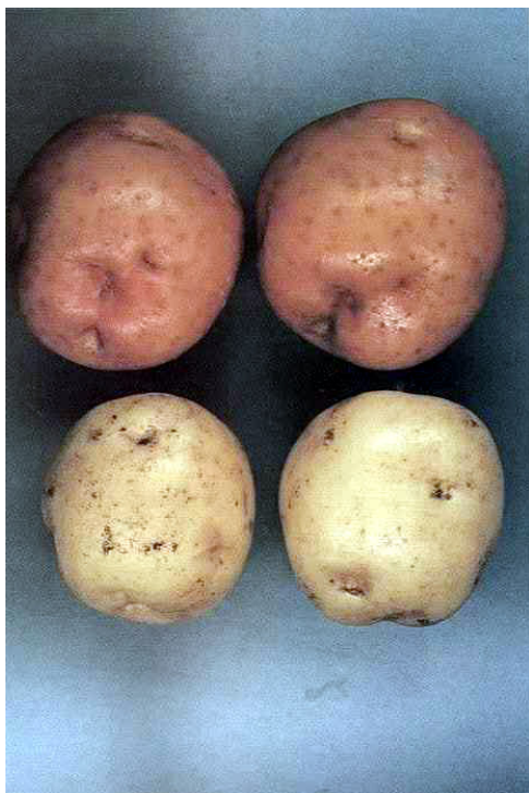
「根育29号」の塊茎 (上：根育29号、下：男爵薯)