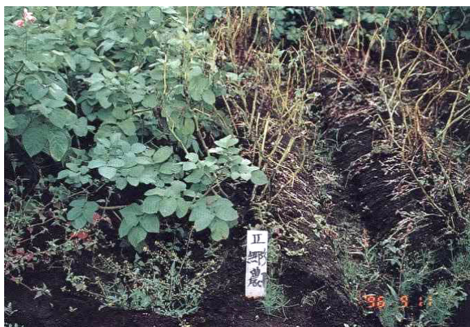
疫病無防除栽培における比較 (左：根育29号、右：農林1号) 根釧農試 平成8年9月11日