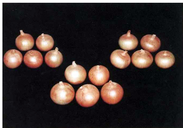
「月交18号」の両親及びF1 (左：種子親「2935A」、中央：「月交18号」、 右：花粉親「CS3-12」)