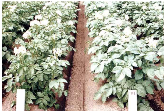
ばれいしょ「根育31号」の草姿 左：根育31号 右：男爵薯