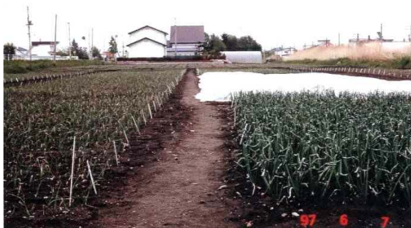
早期作型と普通作型との生育の差異(平成9年6月7日) 左：普通作型 右手前：4/25定植区(べたがけ除去後) 右奥：5/2定植区(べたがけ被覆中)