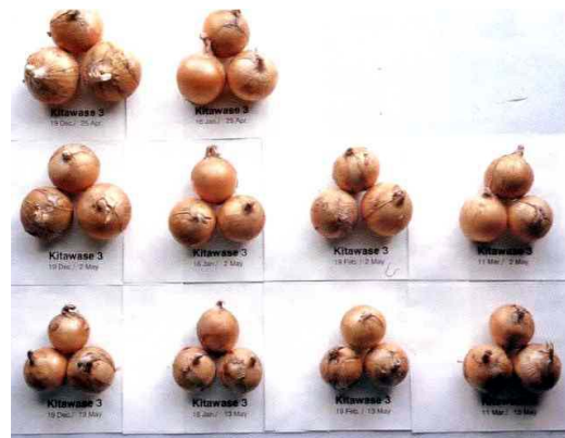
「北早生3号」の収穫球の大きさ (平成9年)