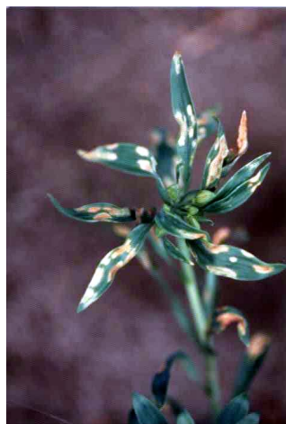
▲TSWVによる葉の退緑斑点