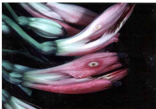
▲灰色かび病による花卉の斑点