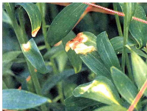
▲灰色かび病による葉の病斑