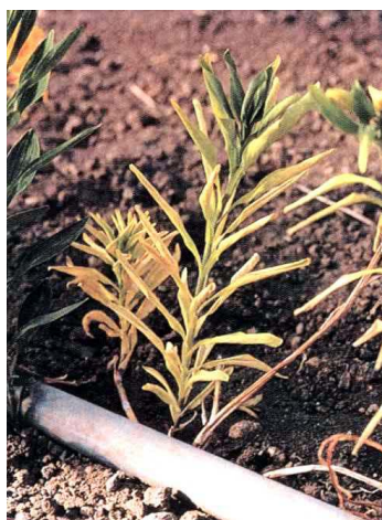
▲疫病による立枯症状