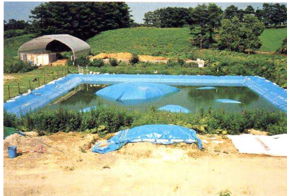
約1年経過した雨水分離シート設置ラグーンの状態