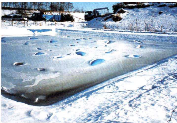
冬季間の雨水分離シート設置ラグーンの状態