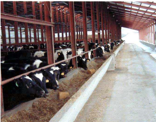
育成期の上手な粗飼料給与による肝膿瘍の低減